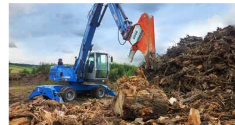
Ideale per la pulizia del pavimento.