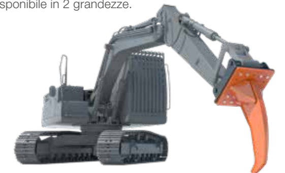
Woodcracker® lama sradicatrice