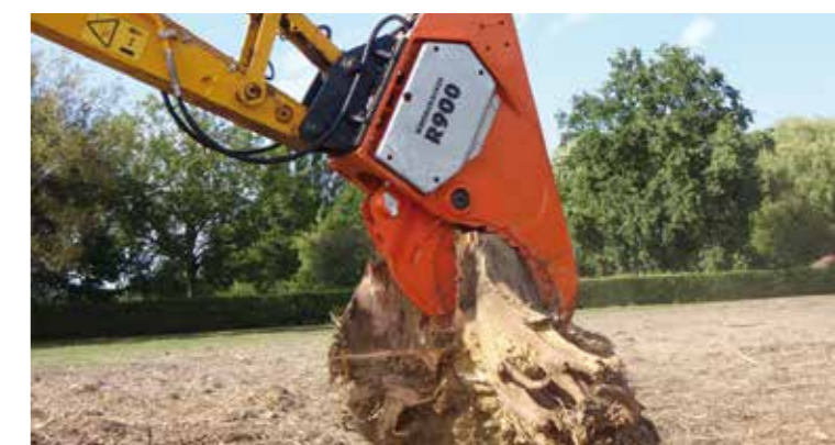
Organo di taglio robusto.