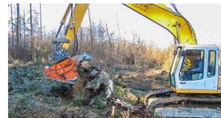
Rimozione delicata della ceppaia dal terreno.