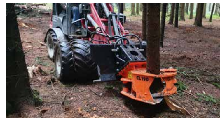
Woodcracker® CL taglia il legno tenero fino a 40 cm.