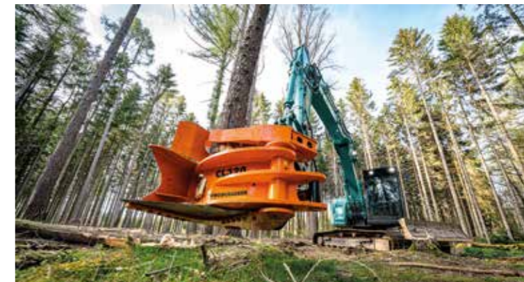
Rapida raccolta di piccoli alberi.