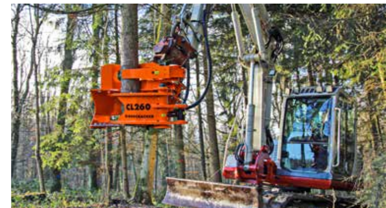
Opzionalmente anche con pinza raccogliatrice.