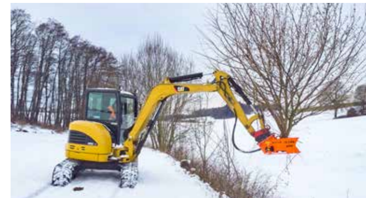
Per miniescavatori a partire da 2,5 t.